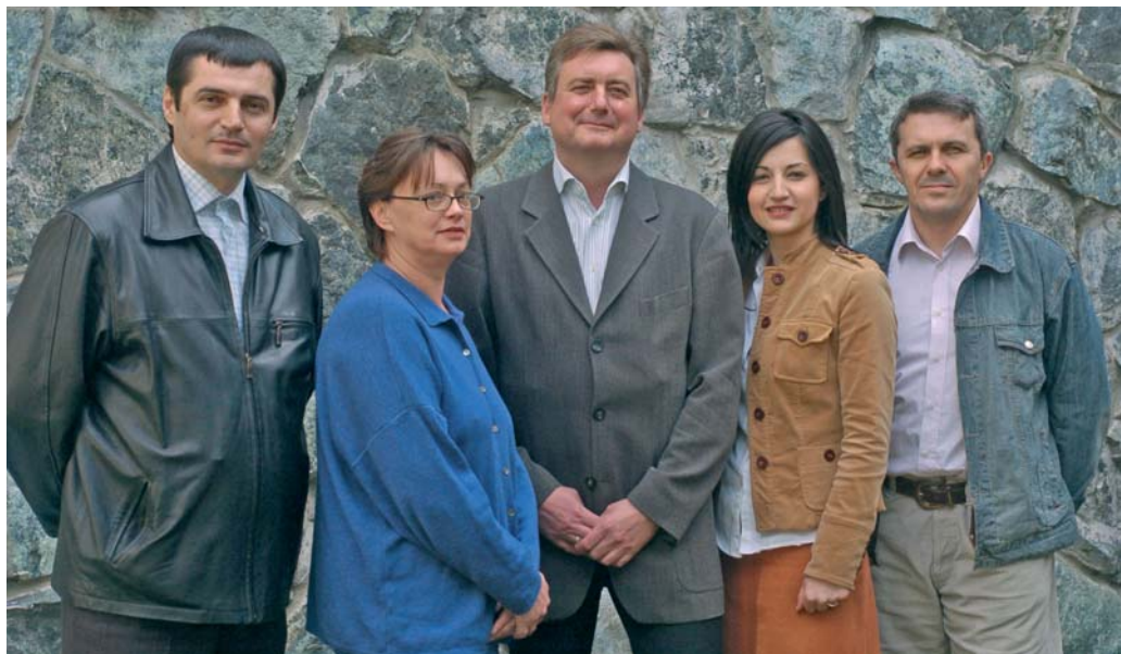
FES tim za radne odnose i socijalni dijalog

O d pre dve godine počela je sa radom još jedna, regionalna kancelarija Fondacije Fridrih Ebert, čiji su prioriteti unapređenje radnih odnosa i pitanje socijalnog dijaloga u Jugoistočnoj Evropi. Saradnja sa sindikatima i njihovim socijalnim partnerima spada među ključne zadatke Fondacije Fridrih Ebert. Zbog toga su još 1990. god. uspostavljeni projekti za sindikalnu saradnju u Srednjoj i Jugoistočnoj Evropi.