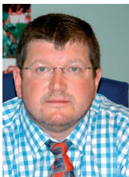
Peter Scherer, Generalni sekretar Evropskog Saveza Sindikata Metalaca (EMB) B

FES-u želim da uspešno nastavi svoju sindikalnu delatnost pomirenja, što je u interesu svih evropskih sindikalnih udruženja i da joj se za to pruži neophodna politička i materijalna potpora. Svima koji se zauzimaju za ovaj cilj se zahvaljujem.