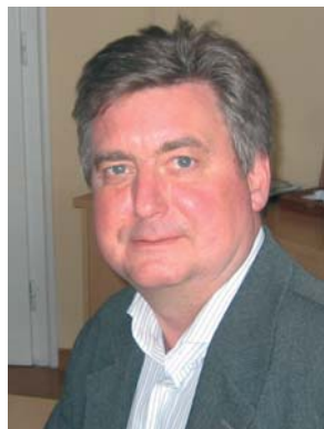
Frank Hantke Direktor regionalne kancelarije FESa za radne odnose i socijalni dijalog sa sedištem u Beogradu

Zbog toga je potrebno da se nastavi sa ovim delovanjem i u godinama koje dolaze. Priželjkujemo i ubuduće prijateljski odnos i saradnju sa našim partnerima, želimo da pomognemo u produbljivanju saradnje sa partnerima iz Nemačke i Evropske unije i na taj način skromno doprinosemo integraciji Srbije u region i Evropsku uniju.