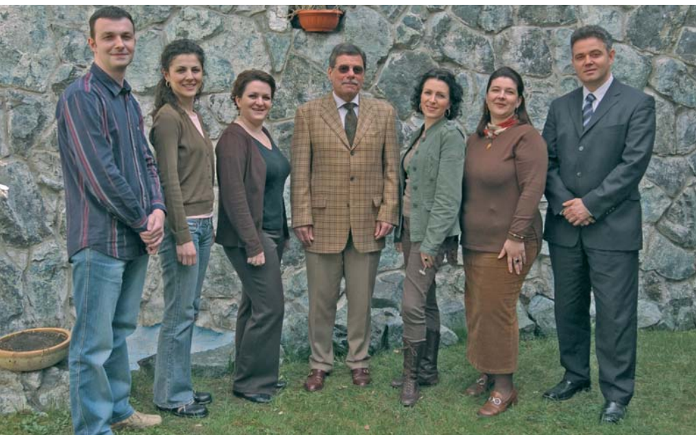
FES tim za nacionalne projekte

U Srbiji i Crnoj Gori fondacija Friedrich Ebert podržava razvoj civilnog društva i demokratizaciju društvenih struktura kroz seriju projekata. Partneri fondacije na ovim prostorima su, pored ostalih, politički edukativni centri, nevladine organizacije, sindikati, naučne ustanove, slobodni mediji, itd.