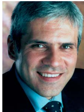
Boris Tadić, predsednik Demokratske stranke

Prisustvo Fondacije Friedrich Ebert u Srbiji i Crnoj Gori je od velikog značaja, ne samo za našu stranku, već i za celokupno društvo i nadam se da ćemo i u narednim godinama saradivati na demokratizaciji i modernizaciji naše zemlje i ubrzanim pripremama za integraciju u Evropsku Uniju.