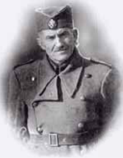
NA STRANI OKUPATORA: DIMITRIJE LJOTIĆ I MILAN NEDIĆ