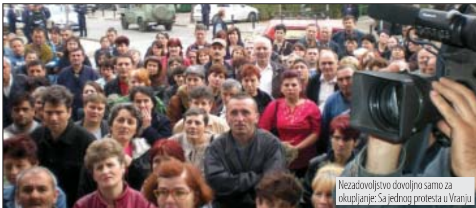
Nezadovoljstvo dovoljno samo za okupljanje: Sa jednog protesta u Vranju