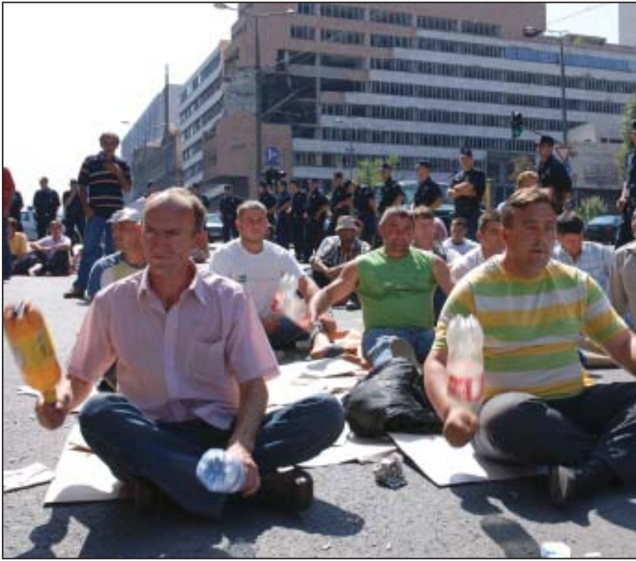
Ovog leta čak su i poljoprivrednici uspeali da štrajkuju ispred Vlade: Protest malinara u Beogradu

stitucija očekivala, a to je značajno smanjenje broja zaposlenih u državnoj administraciji. Međutim, poverenje ne uliva činjenica da vlast zvanično nije pomenula mogućnost smanjivanja broja ministarstava, navodi Stojiljković