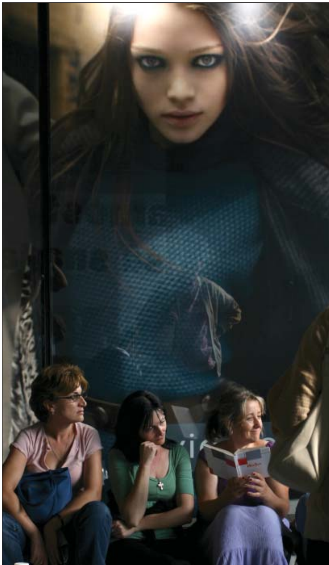
Noći provedene na beogradskim ulicama donele rezultat samo najupornijima: Radnice Zastave elektro iz Rače tokom avgustovskih protesta

U FOKUSU - Uoči okruglog stola o rezultatima tranzicije u vreme globalne krize