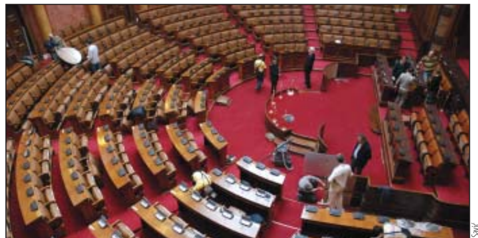
U vreme najvećeg broja protesta u Srbiji poslanici bili na produženom godišnjem odmoru: Dom Narodne skupštine