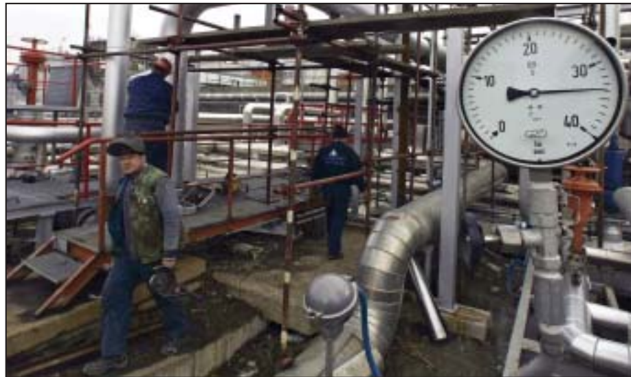
Gotovo 25.000 ljudi očekivalo 200 evra po godini staža: Radnici NIS-a na poslu

Rok nije poštovan zbog birokratsko-tehničkih problema koji su u međuvremenu rešeni. Međutim, veliko radničko nezadovoljstvo izazvaće činjenica da će kada proces konačno bude završen akcije vredeti znatno manje nego što očekuju sindikati. Naime, 24.890 sadašnjih i bivših radnika NIS-a očekuje prenos akcija u vrednosti od 200 evra po godini radnog staža, ali na kraju kada obračun bude obelodanjen cifra neće premašivati 71 evro po godini radnog