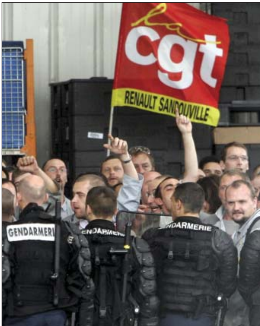
Od socijalnog sloma do razarajućih političkih posledica: Protesti radnika tokom posete predsednika Nikole Sarkozija fabrici Reno

Nasilni protesti u Francuskoj, ali i u Letoniji i Rusiji zabrinuli su evropske lidere koji strahuju da mogu da nastanu neredi, daleko opasniji od onih iz 1968. Nezaposlenost u Francuskoj raste po najvećoj stopi u poslednjih 15 godina, a potrošnja se strmoglavila. Radnici u Francuskoj skloni su ekstremnijim metodama kako bi dali oduška svom strahu od budućnosti. Tako su zaposleni u fabrici automobila Reno letos zapretili da će fabriku dići u vazduh, nezadovoljni zbog otpuštanja. Ukoliko uprave žele „da začepi uši“ pred zahtevima radnika, rešenje može biti i otmica direktora. Još prošle godine je zarobljen direktor jedne fabrike Mišlen, iskustvo koje je doživeo i direktor Sonija