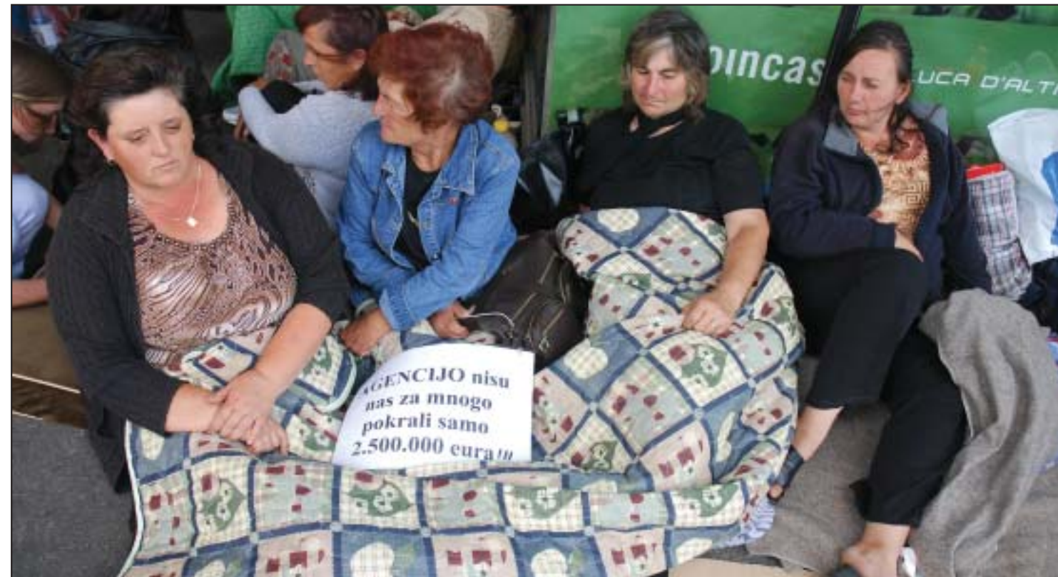
Štrajkovi doneli rešenja samo najupornijima. Sa protesta radnika Zastave elektro u Beogradu