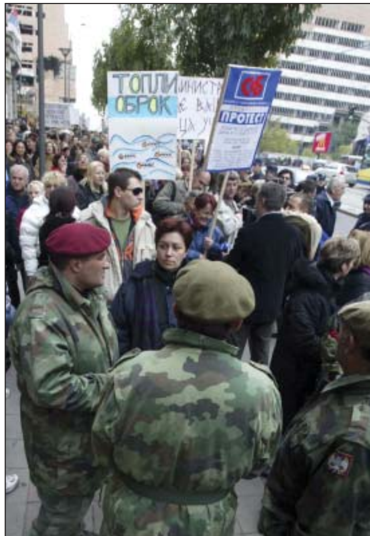
Nekada na istom mestu čak i sa rezervistima, sada spremni na međusindikalnu saradnju: Protest prosvetara