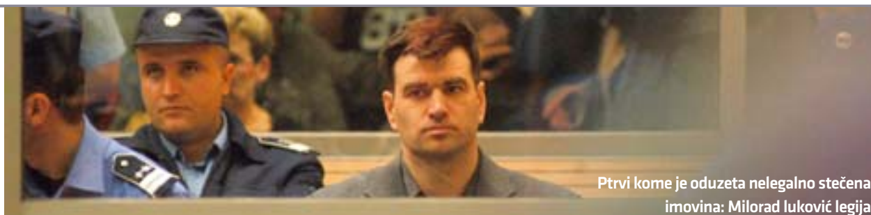
Prvi kome je oduzeta nelegalno stečena imovina: Milorad Luković Legija

Mi smo prešli Rubikon sa donošenjem odluke o oduzimanju imovine Miloradu Ulemeku Legiji pre nekoliko nedelja. To je izuzetno važno. Ulemek predstavlja simbol organizovanog kriminala, simbol svega onog što se loše dešavalo u Srbiji pre nepunih šest godina, a to je ubistvo premijera