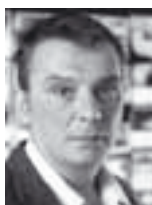
PIŠE: DEJAN ANASTASIJEVIĆ

Vlasnik malog preduzeća koji u normalnim prilikama ne bi ni šljivu ukrao možda će pristati da propere nečiji prljav novac ako je to jedini način da izbegne bankrot, ili će pozajmiti pare od zeleniša i začas se naći u mreži iz koje se teško izlazi. Mlada osoba bez posla i šanse da ga nađe biće u iskušenju da prihvati ponudu za “brzu i laku” zaradu. Organizovani kriminalci vrebaju ovakve mete i spremno nude usluge, prepoznajući način da prošire poslove i mreže