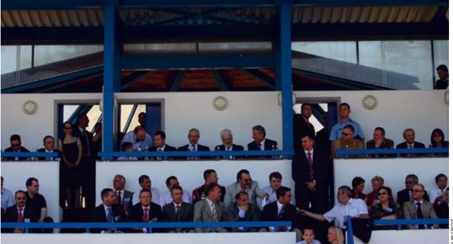
Među zvanicama i direktori policija iz regiona: Proslava dana MUP-a Srbije