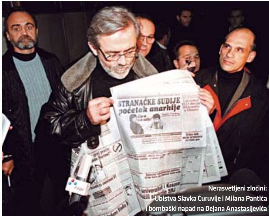
Nerasvetljeni zločini: Ubistva Slavka Ćuruvije i Milana Pantića i bombaški napad na Dejana Anastasijevića

Dokle god se u ovoj zemlji ne reše slučajevi ubistava kolega Slavka Ćuruvije, Milana Pantića, slučaj Dade Vujasinović i, naravno, našeg kolege iz "Vremena" Dejana Anastasijevića kome su eksplodirale bombe na prozoru, novinari se mogu smatrati ugroženima