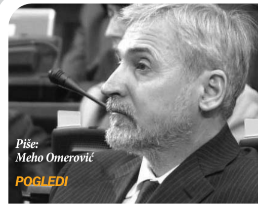
Piše: Mehmed Omerović POGLEDI