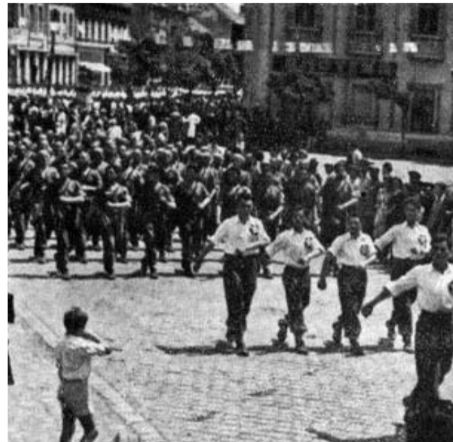
Duga tradicija: Sa jednog prvomajskog defilea