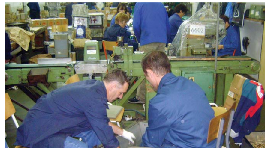
Prekovremeno do 32 sata mesečno: Detalj iz Prvog partizana