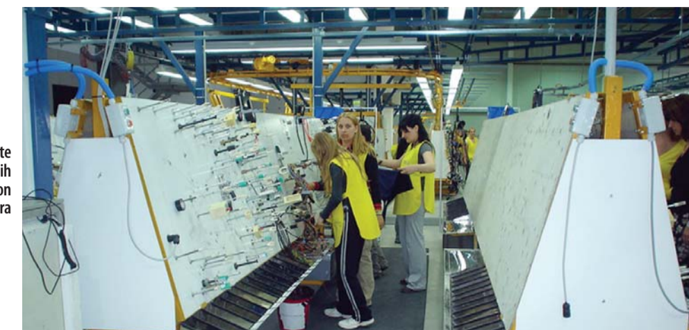
Norme preuzete iz matičnih firmi: Pogon Draksmajera

Praznici su i ove godine izgovor javnom sektoru, a naročito institucijama i ustanovama na budžetu grada Zrenjanina, da manje rade. Efektivan rad u ovakvim firmama teško je ustanoviti. Za razliku od njih, neke privatne firme rade punom parom, a rezultati ne izostaju.