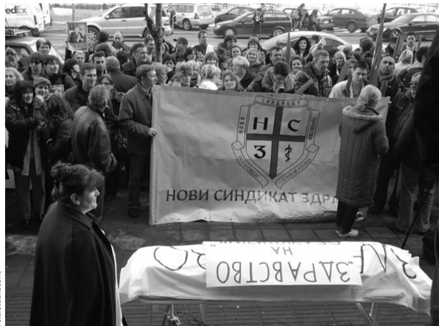
Veće nade ili umor od mitingovanja: Sa prošlogodišnjeg protesta u Beogradu

Osnivanje sindikata za jedan broj radnika tada u Srbiji značio je povećanje nadnica, skraćivanje radnog vremena, povoljnije uslove rada, dok su drugi radnici koji nisu bili organizovani u sindikate i dalje radili u krajnje teškim uslovima.