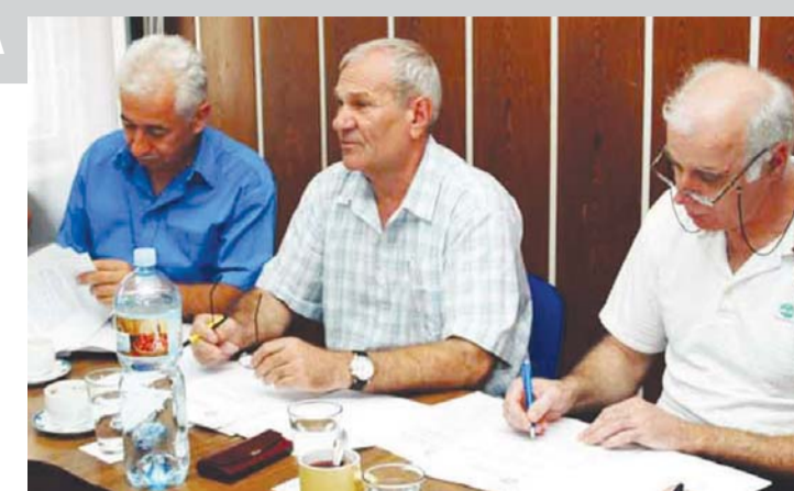
Članovi Predsedništva SSS Beograda

- Ima slučajeva da privatni poslodavci ne isplaćuju zarade kakve treba ili nadoknade, ali nam se do sada niko nije javio, verovatno iz straha od gubitka posla. Ukoliko nam se obrati naš član, čak i ako nema sindikalne organizacije u toj ustanovi, mi ćemo obavestiti inspekciju rada i pružiti svu pomoć, zaključuje predsednik GS ZSZ Nezavisnost. J. D. T.