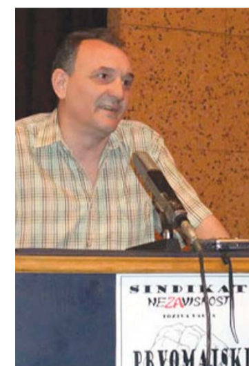
Da pomaka ima, pokazuju i primeri potpisanih kolektivnih ugovora u Subotici i Jagodini

Na osnovu odluke o proširenom dejstvu, odredbe posebnog kolektivnog ugovora obavezujuće su i za zdravstvene ustanove u privatnom sektoru. Predstavnici poslodavaca tih ustanova uputili su zahtev za ocenu ustavnosti primene kolektivnih ugovora.