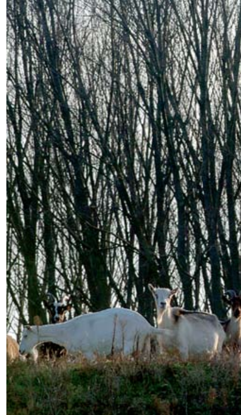
ПРАВО: ВРЕМЕ ЈЕ ЗА ПОШТОВАЊЕ ВЛАСНИШТВА,

(граничарских) имовних општина стечених самовласним заузећем пре 28. августа 1945. године.