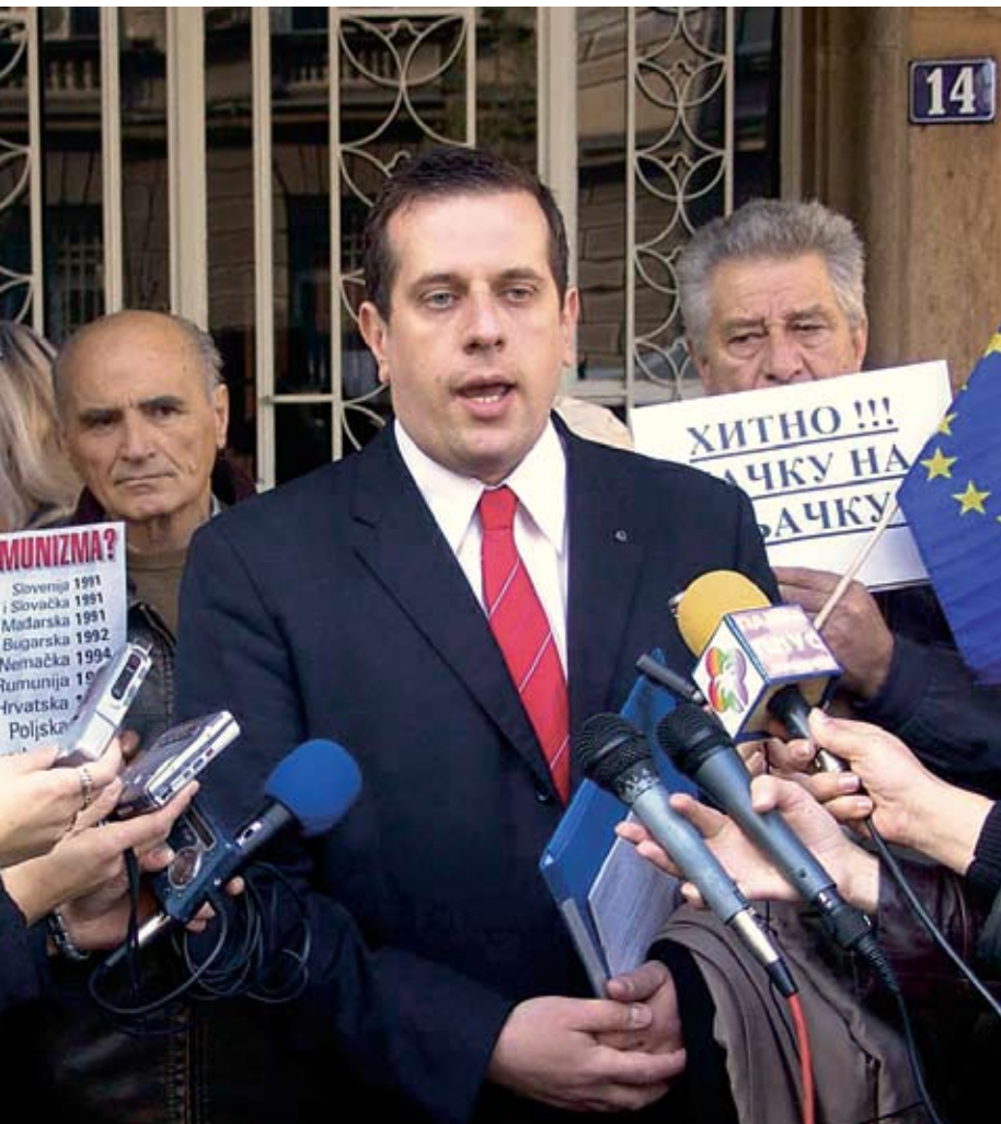
ТАЧКУ НА ПЉАЧКУ: ПРОТЕСТ МРЕЖЕ ЗА РЕСТИТУЦИЈУ

Министарство финансија је недавно најавило да ће током овог месеца обе-