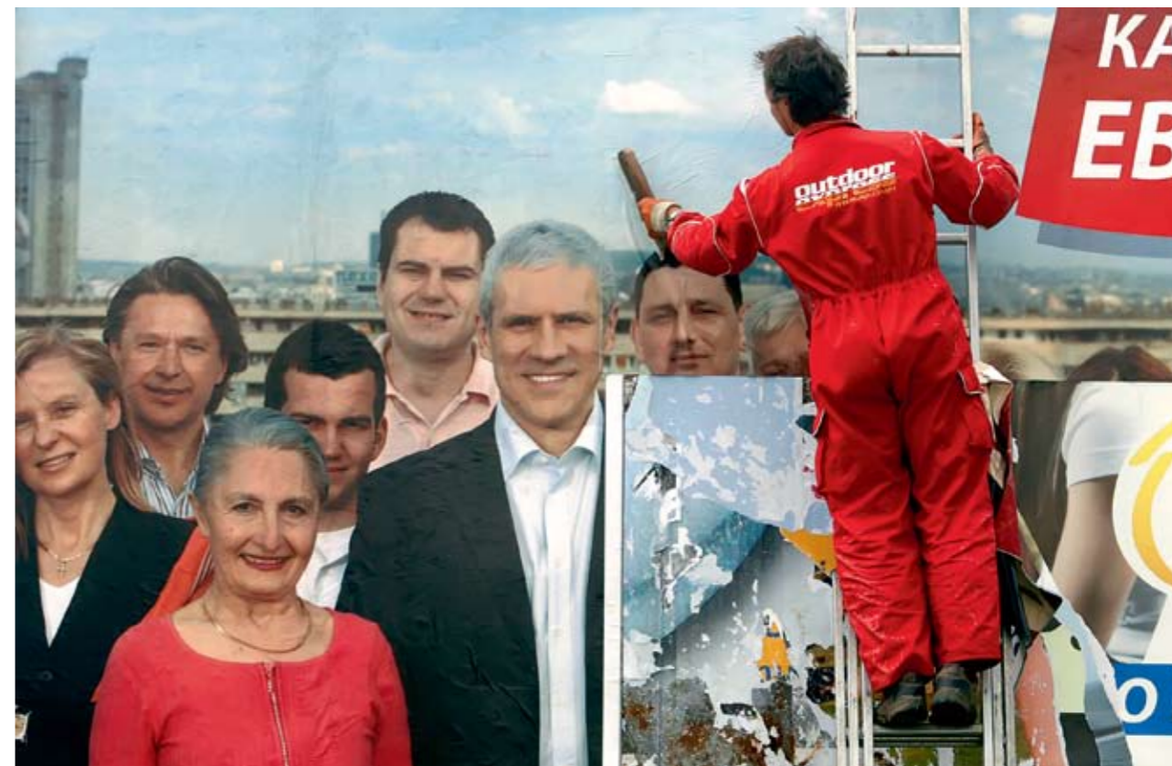
НОНСЕНС: ВЕЛИКИ БРОЈ ОПШТИНА, ПА И РЕГИОНА НЕМА СВОЈЕ ПРЕДСТАВНИКЕ У ПАРЛАМЕНТУ

Други проблем, редослед на листи посланика, свој корен има у једном члану Закона о избору народних посланика. Овим чланом се дефинише да подносилац листе по проглашењу резултата има период од десет дана како би са листе од 250 имена одабрао кандидате за народне посланике који ће добити мандат. На овај начин се између грађана и њихових представника у Скупштини Србије намеће посредник који практично бира ко ће бити представници у највишем законодавном телу. Зато су неки посланици изјављивали да је битније „играти баскет са председником странке“ него бити у сталној комуникацији са грађанима и радити на страначкој