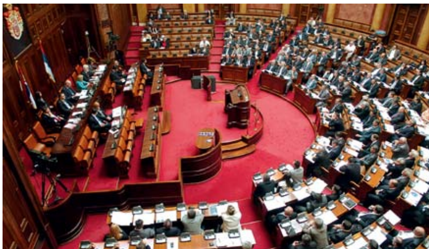
ИЗБОРНА МАТЕМАТИКА: СКУПШТИНА СРБИЈЕ