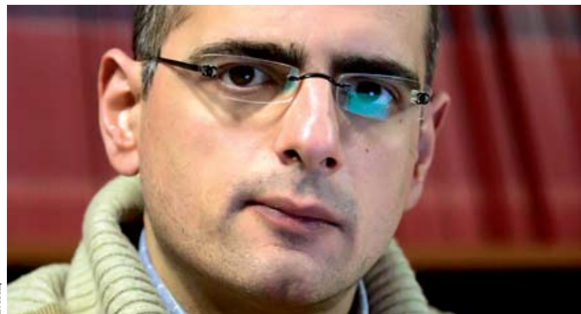
СПОРО: ИЗБОРНО ЗАКОНОДАВСТВО САМО ЈЕ ЗА ТРУНКУ БОЉЕ

Поред питања легитимности и транспарентности, непостојање унутарстраначке демократије директно производи негативну селекцију кадрова и осиромашује наш политички опус. Без улажења у детаље, многи страначки активисти су се повукли из политичког живота управо под тврдњом да су странке аутократски вођене. У 2011. постаје очигледно да само унутрашњом демократизацијом странке могу повећати кредибилитет, омасовити своје чланство, мобилизовати најквалитетније људе и вратити поверење грађана у јавни ангажман.