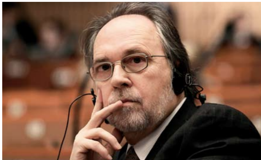
ИЗАЗОВИ ТЕК ПРЕДСТОЈЕ: ДИК МАРТИ

је до сада избегавао да се позабави овим питањем и чињеницом да он не може да пружи адекватну заштиту сведоцима, што је било нарочито евидентно током првог хашког суђења Рамушу Харадинају, јасно је зашто Влада Србије захтева измештање истраге ван институција ЕУ. Такође, уколико је Еулекс прикривао доказе, онда би он морао да буде објект, а не субјект истраге. О нелагоди Еулекса да до краја истражује све наводе Дика Мартија, нарочито одговорност „Дреничке групе“ ОВК која је била под доминантним утицајем Хашима