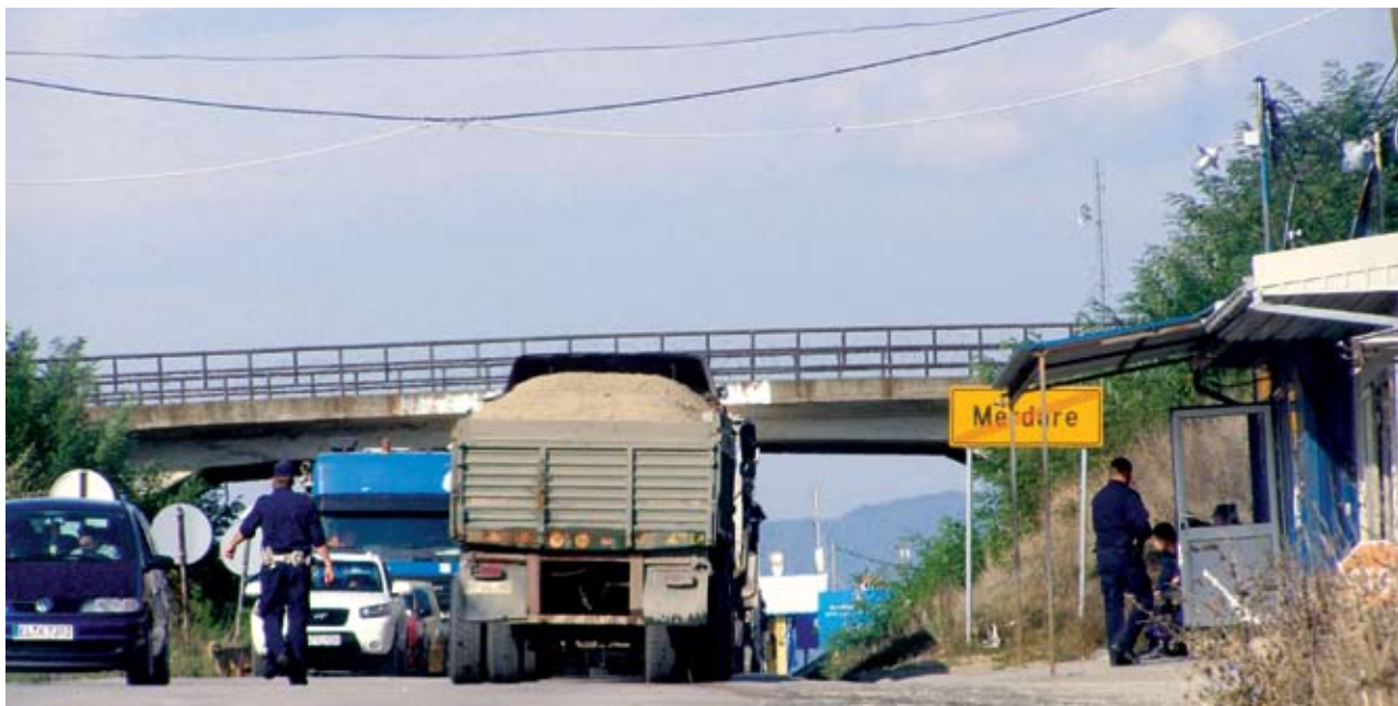
НА ЛИСТИ ШВЕРЦЕРА: ЦИГАРЕТЕ, БЕНЗИН, ЛЕКОВИ, ХРАНА, ЦЕМЕНТ